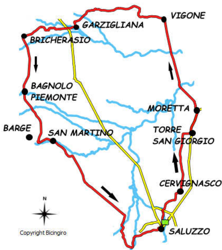
Ciclovie della Pietra e delle Risorgive

Percorso: Saluzzo, Corso Einaudi (parcheggio Cimitero) , percorrere corso Einaudi fino alla rotonda, prendere la terza uscita e imboccare sulla DX via Ruatta Re. Proseguire fino a Torre San Giorgio. Da qui avanti fino a Moretta, poi Villafranca Piemonte e quindi Vigone. A Vigone imboccare via Pinerolo, attraversare la SP129 proseguendo su via Luserna, fino ad arrivare di nuovo sulla SP129. Girare a DX, seguirla brevemente, poi svoltare a SX all'altezza della Cappella Stella. Proseguire direzione Macello, poi attraversare il torrente Chisone dirigendo verso Garzigliana e poi Bricherasio. Continuare direzione SUD fino a Bagnolo Piemonte. Imboccare via della Pietra fino a Barge. Prendere via Boardi fino ad incrociare la SP28. Percorrerla per un paio di km, poi svoltare a SX ritrovando via della Pietra (o via Barge Vecchia). Proseguire fino a Saluzzo.